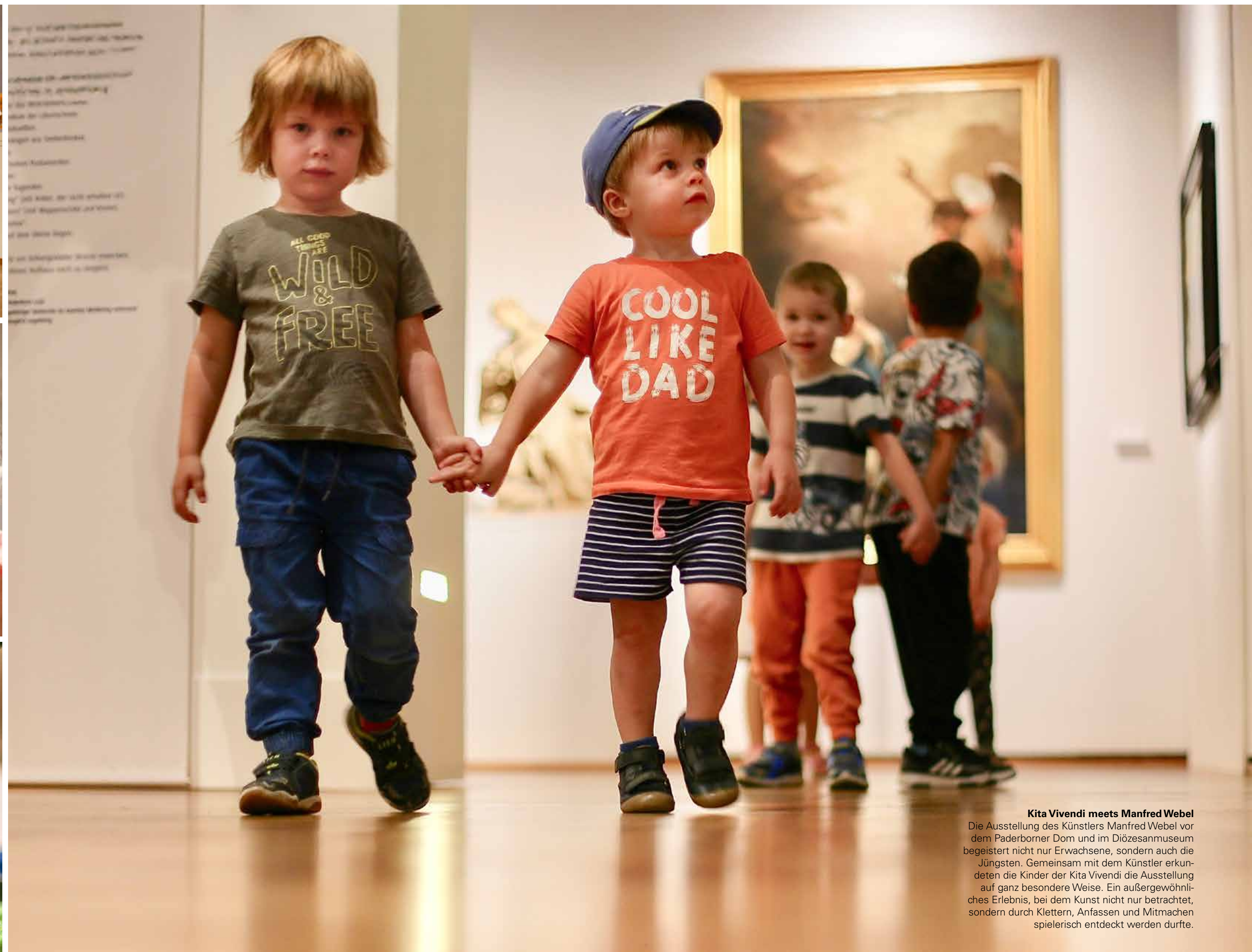
Kita Vivendi meets Manfred Webel Die Ausstellung des Künstlers Manfred Webel vor dem Paderborner Dom und im Diözesanmuseum begeistert nicht nur Erwachsene, sondern auch die Jüngsten. Gemeinsam mit dem Künstler erkundeten die Kinder der Kita Vivendi die Ausstellung auf ganz besondere Weise. Ein außergewöhnliches Erlebnis, bei dem Kunst nicht nur betrachtet, sondern durch Klettern, Anfassen und Mitmachen spielerisch entdeckt werden durfte.