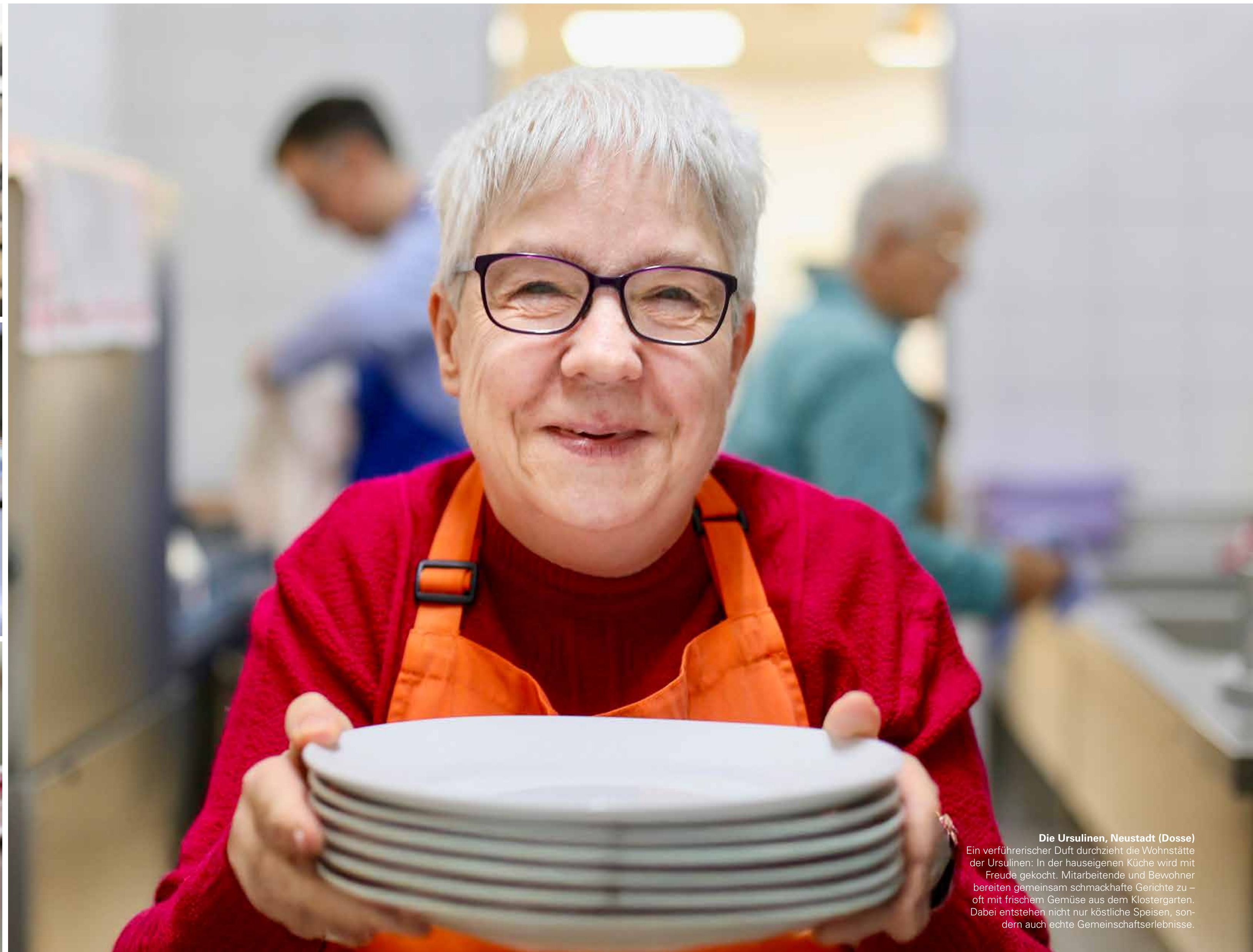
Die Ursulinen, Neustadt (Dosse) Ein verführerischer Duft durchzieht die Wohnstätte der Ursulinen: In der hauseigenen Küche wird mit Freude gekocht. Mitarbeitende und Bewohner bereiten gemeinsam schmackhafte Gerichte zu – oft mit frischem Gemüse aus dem Klostergarten. Dabei entstehen nicht nur köstliche Speisen, sondern auch echte Gemeinschaftserlebnisse.