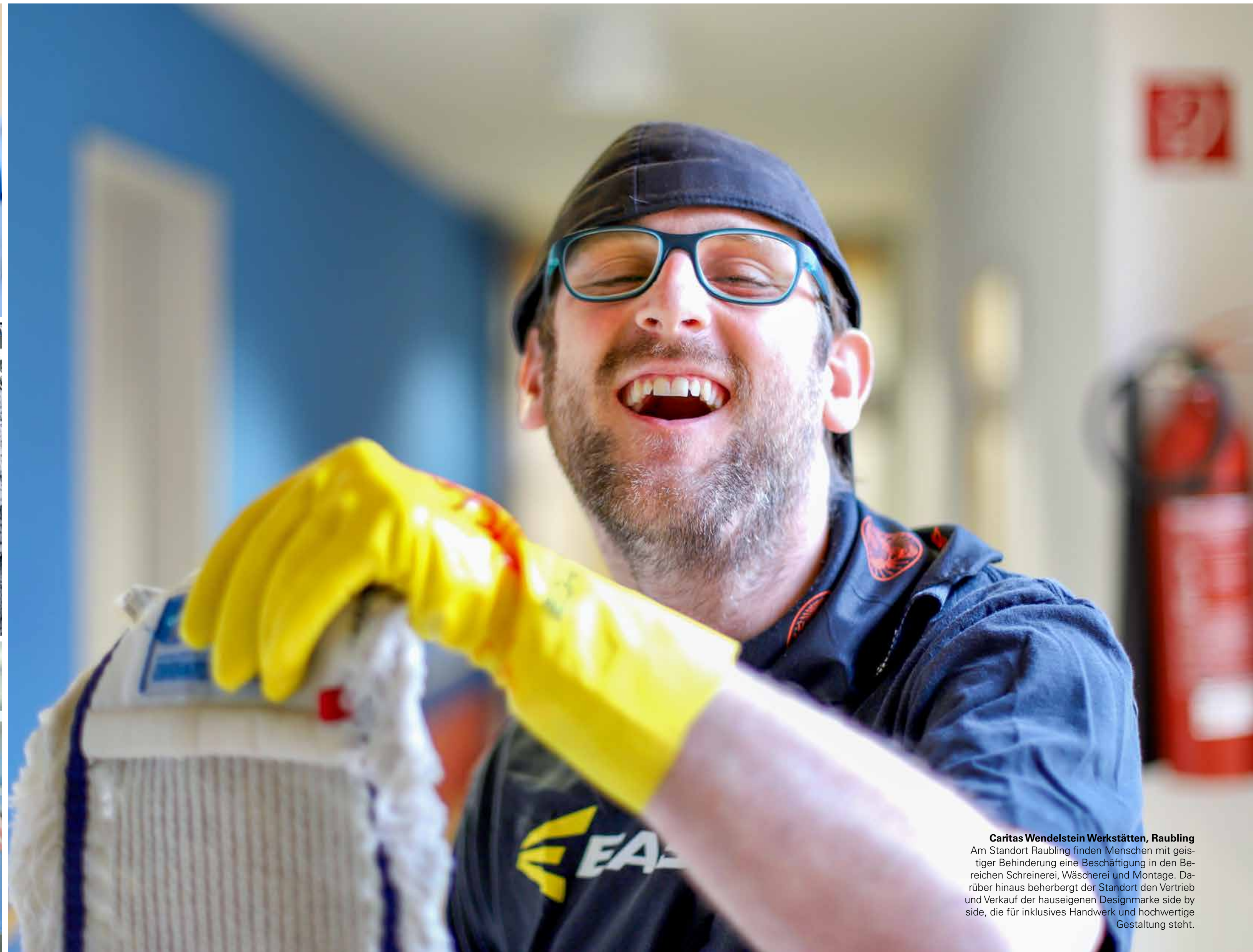
Caritas Wendelstein Werkstätten, Raubling Am Standort Raubling finden Menschen mit geistiger Behinderung eine Beschäftigung in den Bereichen Schreinerei, Wäscherei und Montage. Darüber hinaus beherbergt der Standort den Vertrieb und Verkauf der hauseigenen Designmarke side by side, die für inklusives Handwerk und hochwertige Gestaltung steht.