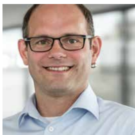
Andreas Koch Service & Consulting