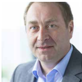
Franz Jakobs Service & Consulting