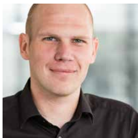
Marc Martin Consulting