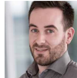
Malte Friedrich Service & Consulting